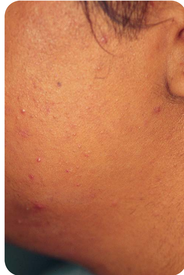
6 Monate nach 5 Behandlungen