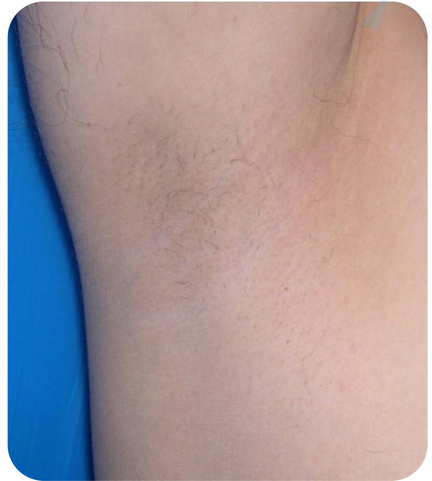
6 Wochen nach 2 Behandlungen