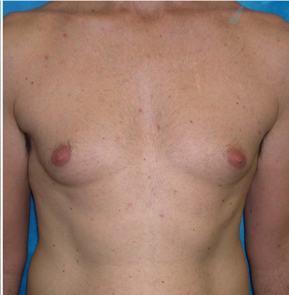
2 Monate nach 7 Behandlungen