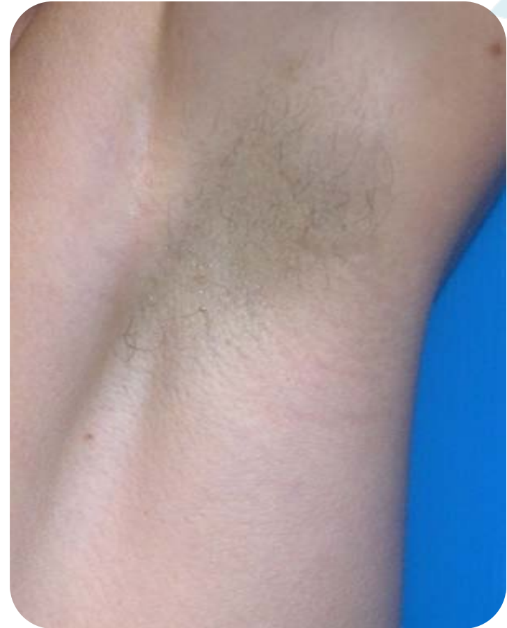
6 Wochen nach 3 Behandlungen