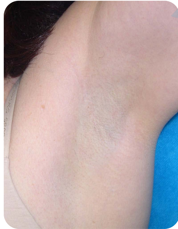
7 Wochen nach 6 Behandlungen