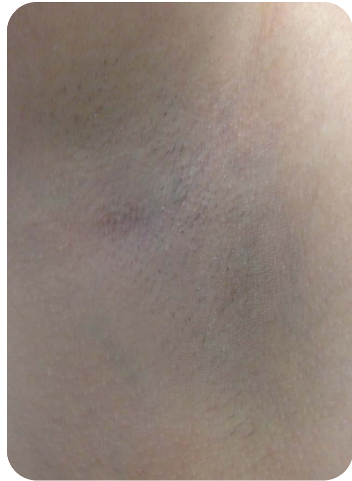
Nach 4 Behandlungen