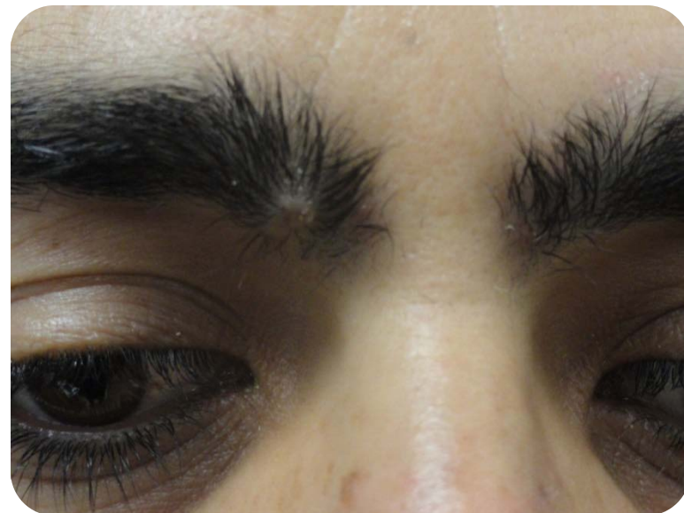
3 Monate nach 5 Behandlungen